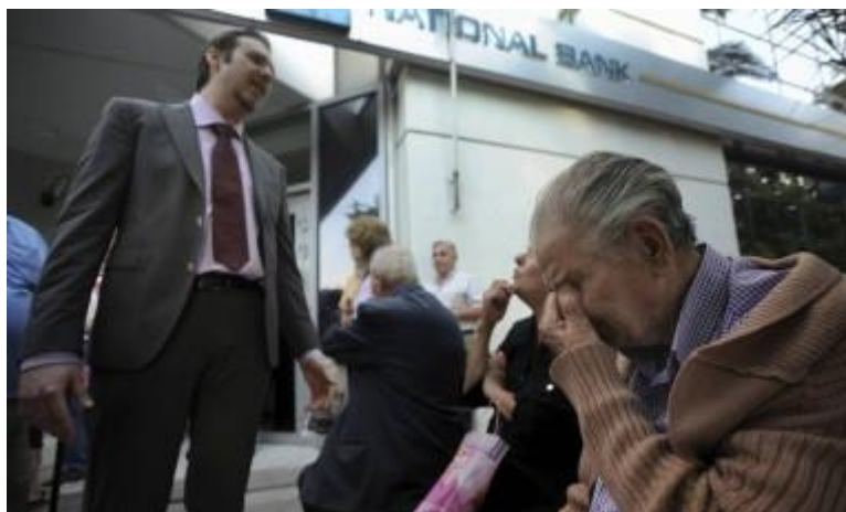
Idoso chora ao não conseguir sacar seu dinheiro na Grécia

Se bloquearam a comunicação através de um aplicativo utilizado por milhões de brasileiros, porque não fariam com o seu dinheiro depositado nos bancos e instituições financeiras? Se acha improvável, peço que repense, pois fizeram o mesmo em um país de primeiro mundo, participante da Zona do Euro, aonde todos achavam que era impossível de ocorrer, esse país se chama Grécia, destino de vários turistas, também fizeram no Chipre e Venezuela, porque não fariam no Brasil neste momento que o governo já anunciou que pode ter um deficit de 110 BILHÕES de reais? Aqui já ocorreu no governo do Collor, em um cenário de inflação alta e crise econômica, seria mera coincidência com o cenário atual que estamos vivenciando? Inflação a 10%, PIB de -3% e desemprego aumentando a números alarmantes! . Muitos vão falar, a diferença é que agora é crime confiscar a poupança, me desculpem, mas também é crime realizar as pedalas fiscais, mas mesmo assim o governo atual fez, e todos envolvidos continuam impunes! Então, acho que está na hora de você REALMENTE se preocupar com seu dinheiro no banco! Se ocorrer como ocorreu este ano na Grécia, não o confisco, mas o controle de capitais, permitindo que você e sua família saquem apenas R$ 60,00 por semana, bloqueando transações via TED, DOC, transferências eletrônicas, cartões de crédito e débito, como você compraria comida para sua família,